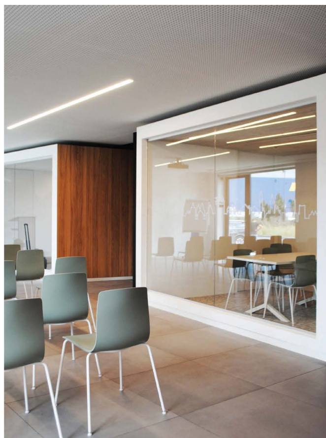
cockpits en vergaderzalen