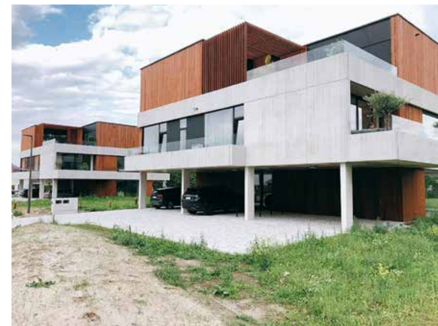
Een interessant architecturaal gegeven is dat de zes urban villa's gelijkaardig, maar niet identiek zijn.