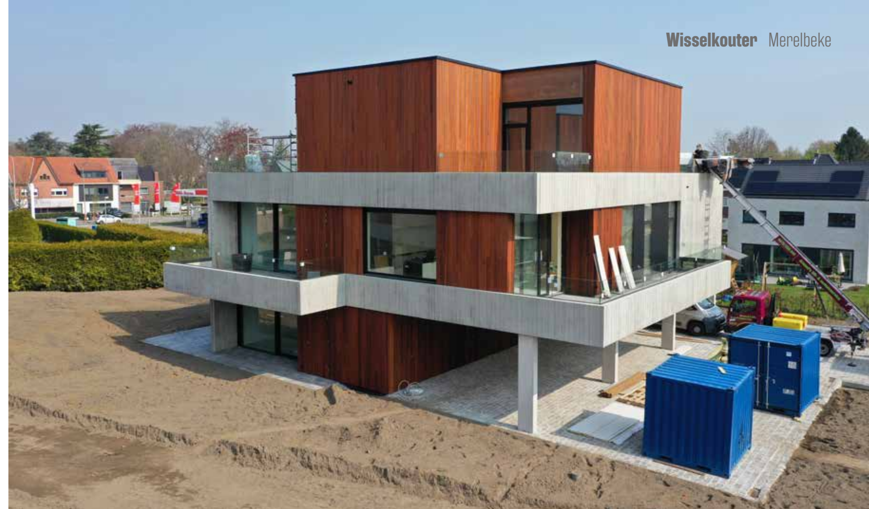
Bouwtechnisch schuldte de grootste moeilijkheid in de uitkragende terrassen met de bijbehorende betonnen gevelpanelen.