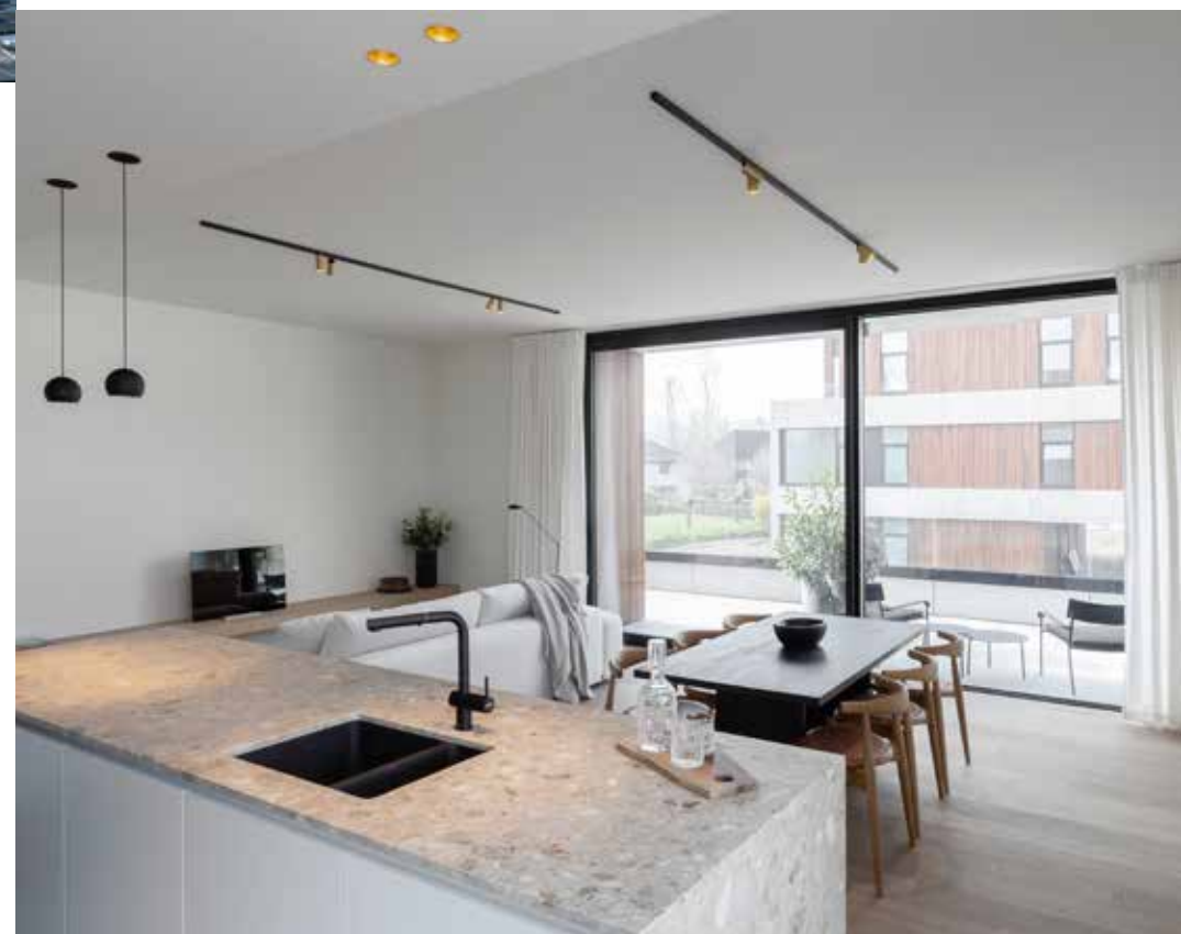
Alle appartementen kregen grote ramen en hoge plafonds, waardoor er sprake is van een aangenaam ruimtegevoel. (Beeld: Yannick Milpas)

zijn in zes lage volumes. Door de gebouwen ook nog eens vrij willekeurig in te planten, ontstaat er een netwerk van groene ruimtes. Samen met verschillende landschapselementen, zoals water-elementen en wandelpaden, en de aanleg van een mooi landschapspark resulteert dit alles in een site waar de beleving van de bewoners volledig op het omringende landschap is gericht."