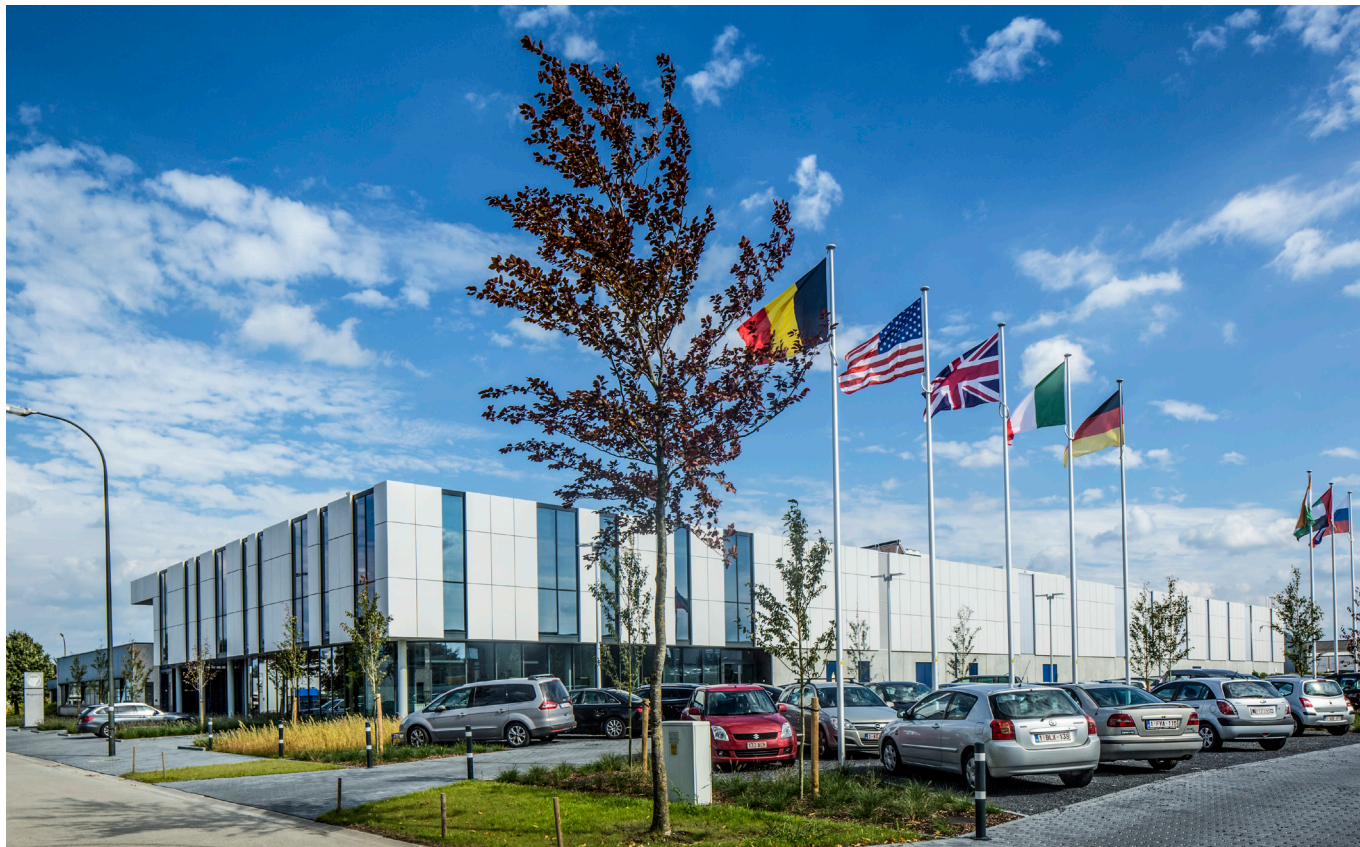
plint productiehal in architectonisch beton + glazen plint kantoorgebouw