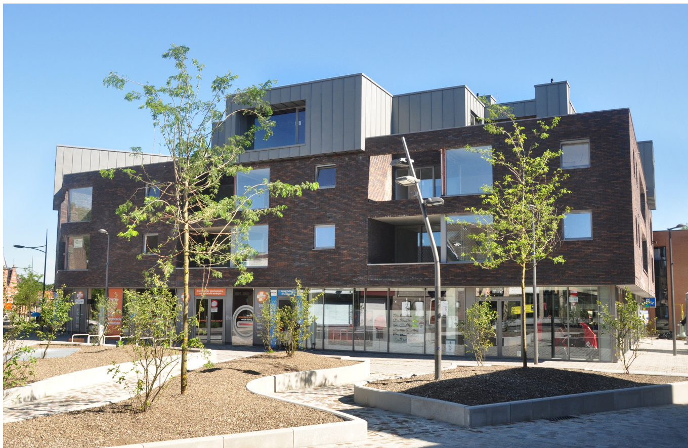
zicht vanaf de Hundelgemsesteenweg op blok B en buitenaanleg