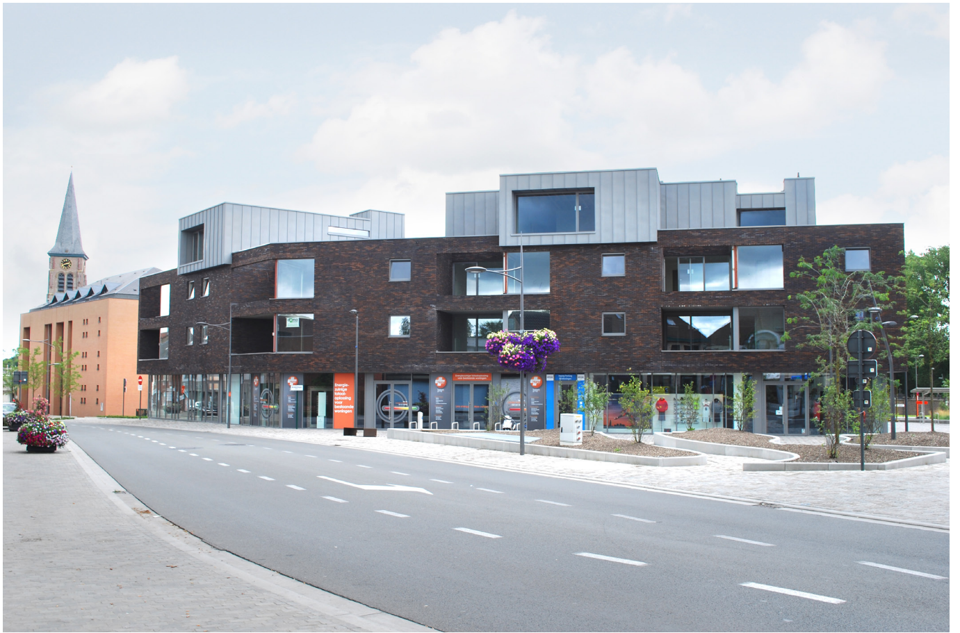
zicht vanaf de Hundelgemsesteenweg richting centrum Merelbeke