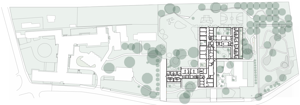
inplantingsplan van de site - Abscis Architecten