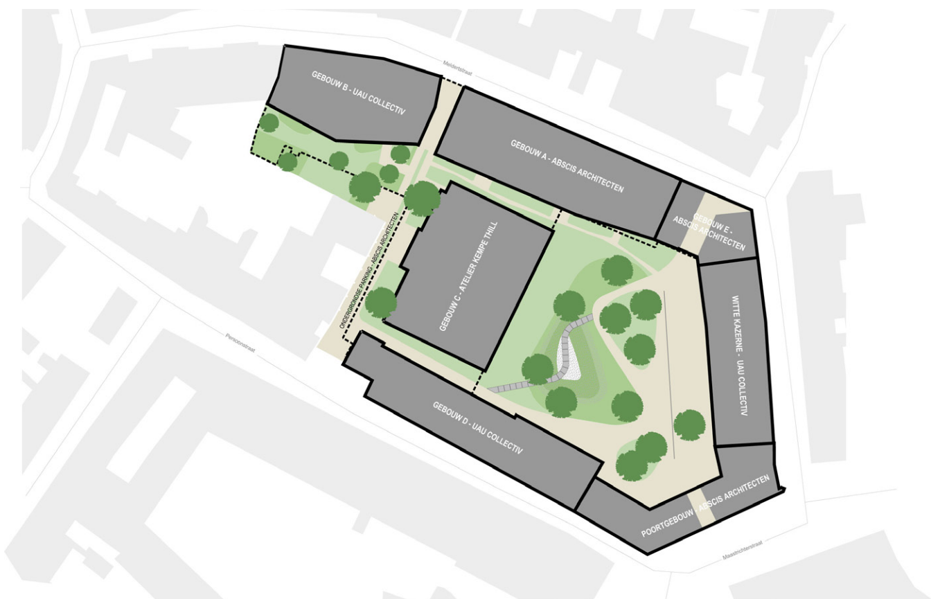
inplantingsplan Abscis Architecten