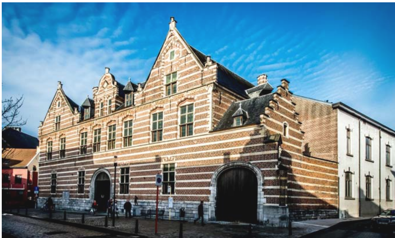
voormalig Refugiehuis, bestaande toestand