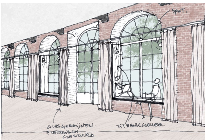
schets van de zitnissen in het atelier