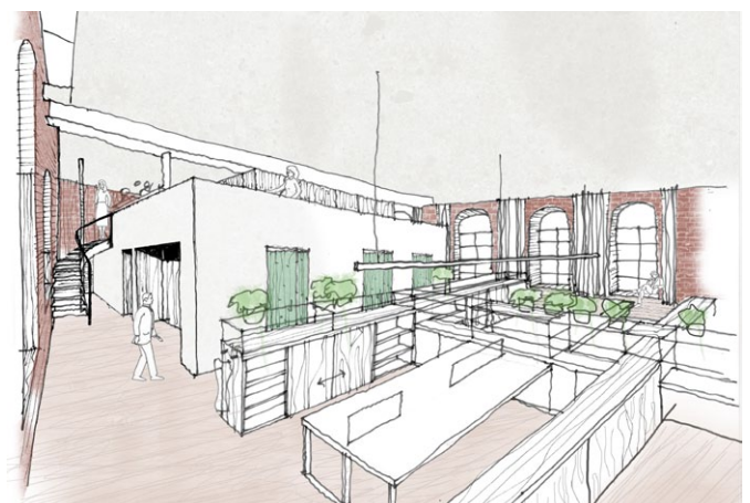
schets van de centrale, multifunctionele kubus